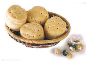
Biscochitos de grasa

Calabaza: è il frutto della pianta Lagenaria vulgaris che una volta svuotato, disseccato e decorato, serve come contenitore del mate e ne assume lo stesso nome.